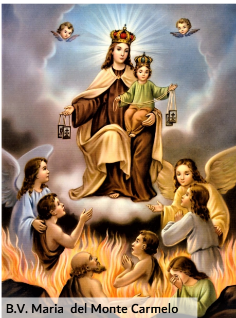
B.V. Maria del Monte Carmelo

Ciascuno di noi si chieda, dunque, cosa deve cambiare affinché la sua esistenza sia conforme agli insegnamenti della Parola, poiché solo in questo modo la preghiera per le vocazioni sarà realmente efficace.