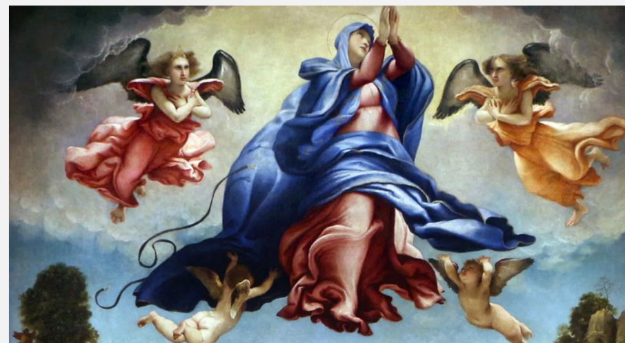
Assunzione della Vergine di Lorenzo Lotto