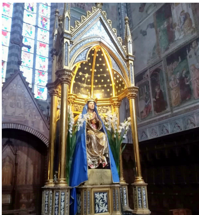
Orvieto, Cattedrale - Immagine dell'Assunta

Chiediamo a tutti di sostenere nella preghiera i giovani coinvolti.