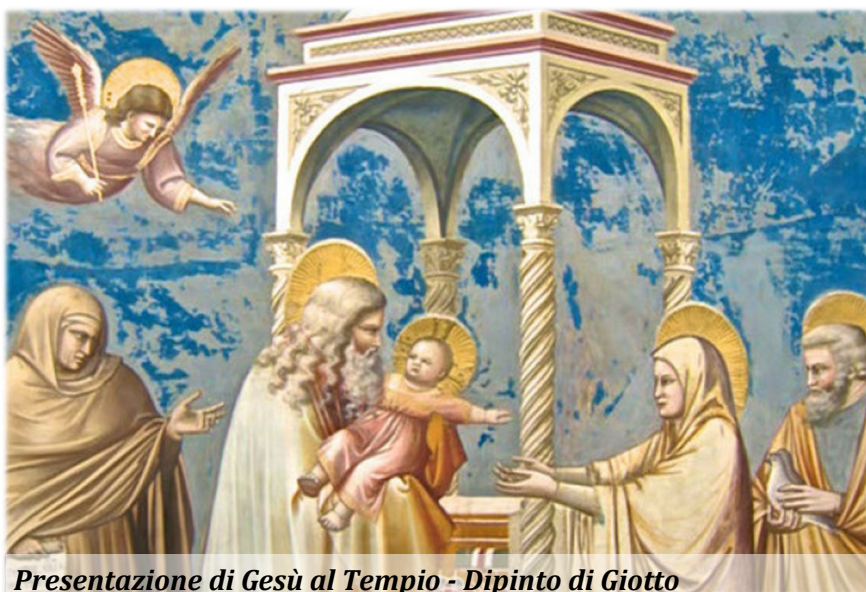
Presentazione di Gesù al Tempio - Dipinto di Giotto