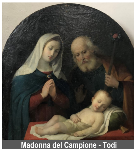
Madonna del Campione - Todì